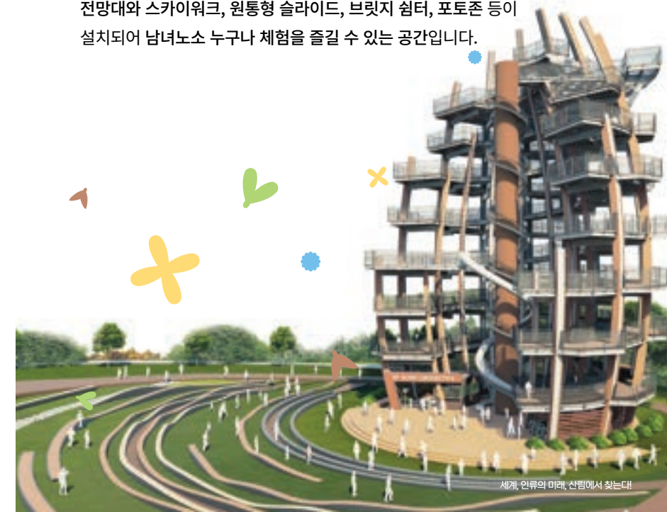
세계, 인류의 미래, 산림에서 찾는다

상부층에는 360° 조망을 할 수 있는 전망대와 스카이워크, 원통형 슬라이드, 브릿지 워터, 포토존 등이 설치되어 남녀노소 누구나 체험을 즐길 수 있는 공간입니다.